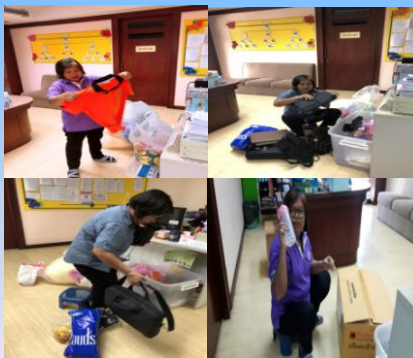
กลุ่มตรวจสอบภายในระดับกระทรวง