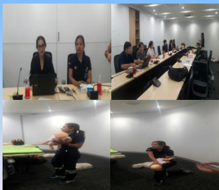
กลุ่มตรวจสอบภายในระดับกระทรวง