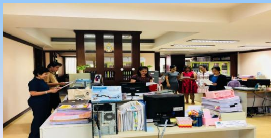
กลุ่มตรวจสอบภายในระดับกระทรวง

ข้าพเจ้าจะเทิดทูนสถาบันชาติ ศาสนา พระมหากษัตริย์ ข้าพเจ้าจะทำงานด้วยความซื่อสัตย์ ยืนหยัดยึดมั่นในสิ่งที่ถูกต้อง ข้าพเจ้าจะอุทิศตน บริกรประชาชนด้วยไมตรีจิต ข้าพเจ้าจะไม่เบียดบังนำเอาของหลวงมาเป็นของตน ข้าพเจ้าจะดำรงชีวิตตามหลักปรัชญาของเศรษฐกิจพอเพียง