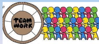
กลุ่มตรวจสอบภายในระดับกระทรวง