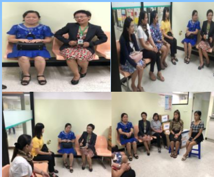
กลุ่มตรวจสอบภายในระดับกระทรวง

“ แบ่งปันเติมฝันให้น้อง ครั้งที่ 1 วันที่ 21 มีนาคม 2561 ”