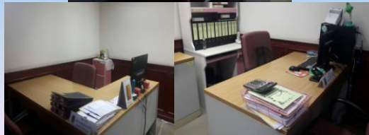
กลุ่มตรวจสอบภายในระดับกระทรวง