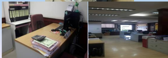
กลุ่มตรวจสอบภายในระดับกระทรวง