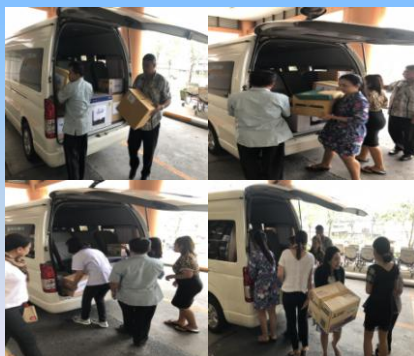
กลุ่มตรวจสอบภายในระดับกระทรวง

ร่วมแรง..รวมใจ..ยกเคลื่อนย้ายพร้อมส่งมอบ