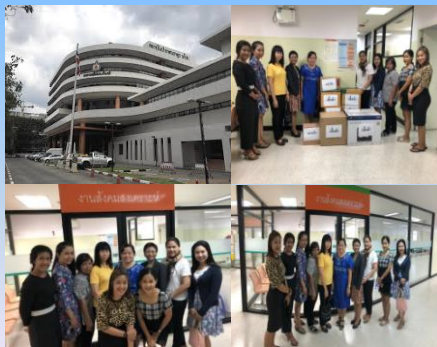
กลุ่มตรวจสอบภายในระดับกระทรวง