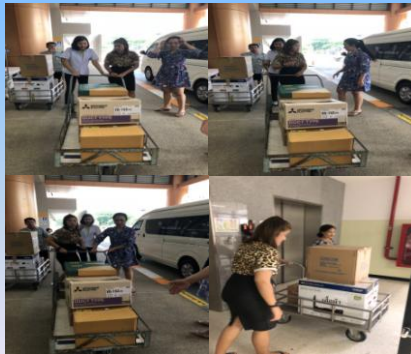
กลุ่มตรวจสอบภายในระดับกระทรวง