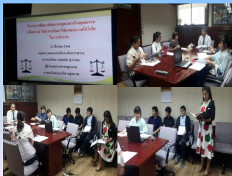
กลุ่มตรวจสอบภายในระดับกระทรวง

“โครงการพัฒนาศักยภาพบุคลากรด้านคุณธรรมจริยธรรม วินัย การรักษาวินัยและความโปร่งใส”