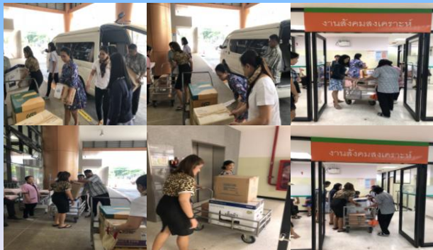
กลุ่มตรวจสอบภายในระดับกระทรวง

ร่วมแรง..รวมใจ..ยกเคลื่อนย้ายพร้อมส่งมอบ