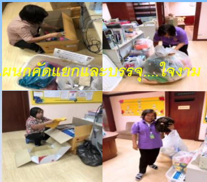
แผนกคัดแยกและบรรจุ...ใจงาม

ปลายทางที่ชมรมกัลยาณมิตรพิชิตทุกข์ สถาบันบำราศนราดูร