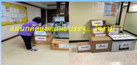
กลุ่มตรวจสอบภายในระดับกระทรวง